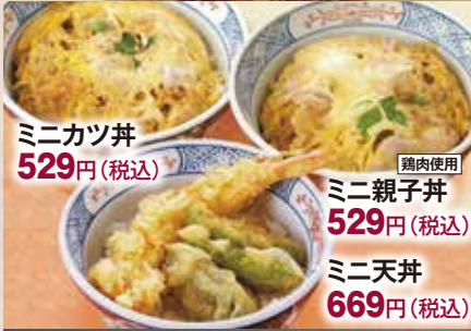
ミニカツ丼 529円(税込) 鶏肉使用 ミニ親子丼 529円(税込) ミニ天丼 669円(税込)