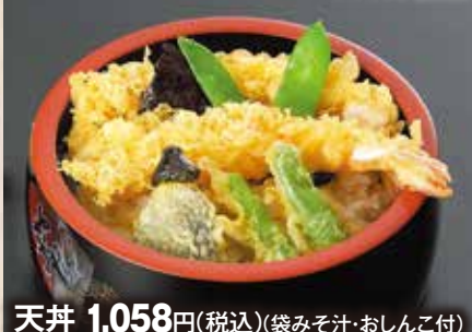
天丼 1,058円(税込)(袋みそ汁・おしんこ付)