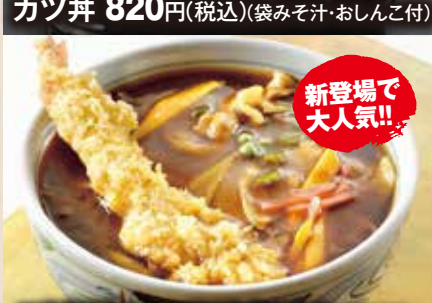
エビ天カレーそば 1,134円(税込)