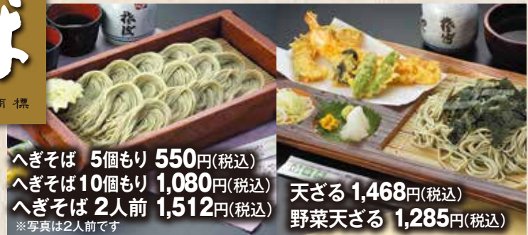
へぎそば 5個もり 550円(税込) へぎそば 10個もり 1,080円(税込) へぎそば 2人前 1,512円(税込) ※写真は2人前です 天ざる 1,468円(税込) 野菜天ざる 1,285円(税込)