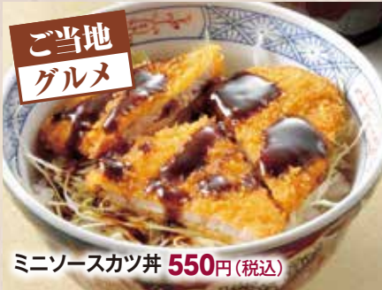
ミニソースカツ丼 550円(税込)