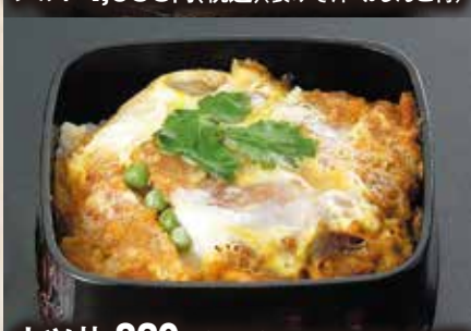
カツ丼 820円(税込)(袋みそ汁・おしんこ付)