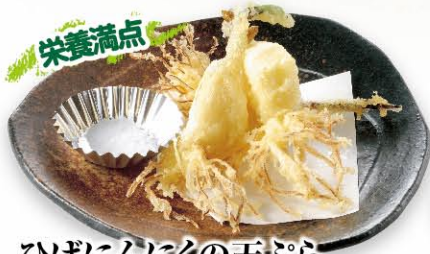
ひげにんにくの天ぷら

◎大盛390円(税込429円) 中盛230円(税込253円) 頂きます。◎小盛マイナス80円(税込88円) お引きします。