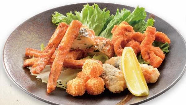
揚げ物盛り合わせ