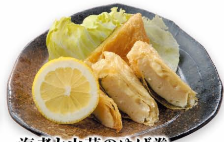
海老と山芋のゆば巻