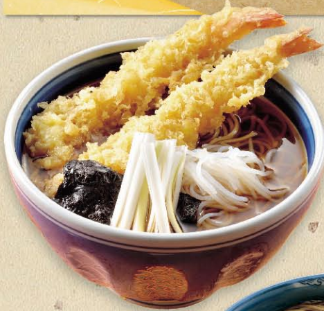
ダブル 天ぷらそば