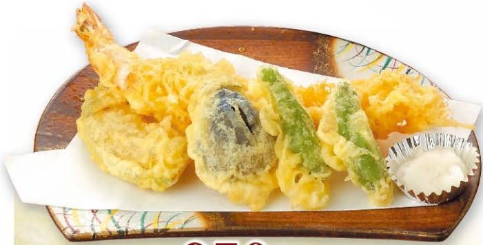
天ぷら 950円 (税込1,045円)