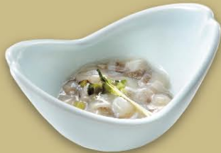
タコのわさび漬 450円(税込495円)