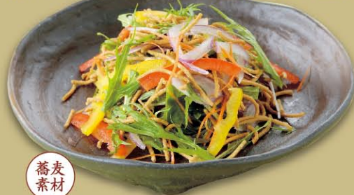
蕎麦 素材 そばサラダ 590円(税込649円)

パリパリの揚げそばと新鮮な野菜を スモークチーズ香るシーザードレッシングでお召し上がりください。