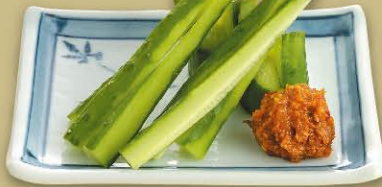
ピリ辛きゅうり 430円(税込473円)

パリパリの揚げそばと新鮮な野菜を スモークチーズ香るシーザードレッシングでお召し上がりください。