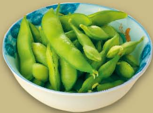
えだまめ 460円(税込506円)