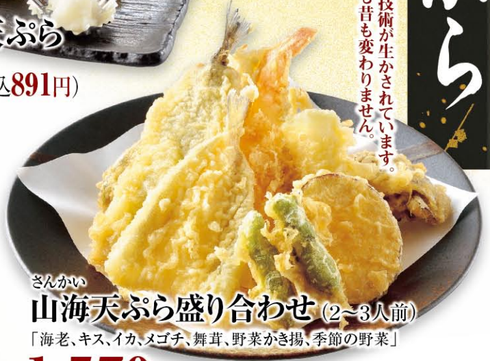
さんかい 山海天ぷら盛り合わせ (2~3人前) 「海老、キス、イカ、メゴチ、舞茸、野菜かき揚げ、季節の野菜」 1,570円 (税込1,727円)