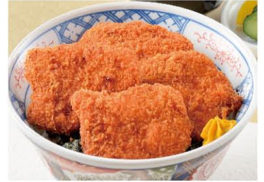
タレカツ丼 1,220円(税込1,342円)