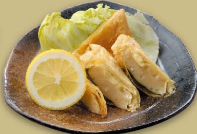
海老と山芋のゆば巻き 660円(税込726円)