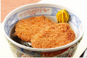
ミニタレカツ丼 790円(税込869円)