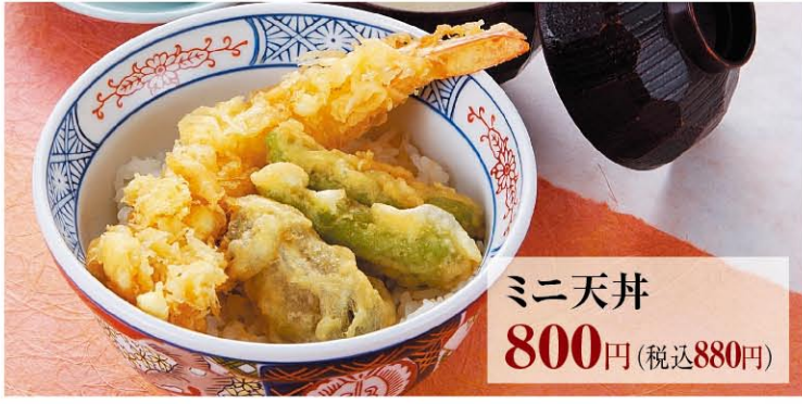
ミニ天丼 800円(税込880円)