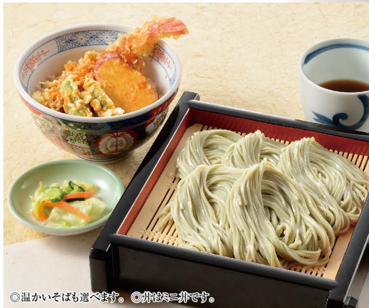
◎温かいそばも選べます。◎井はミニ井です。