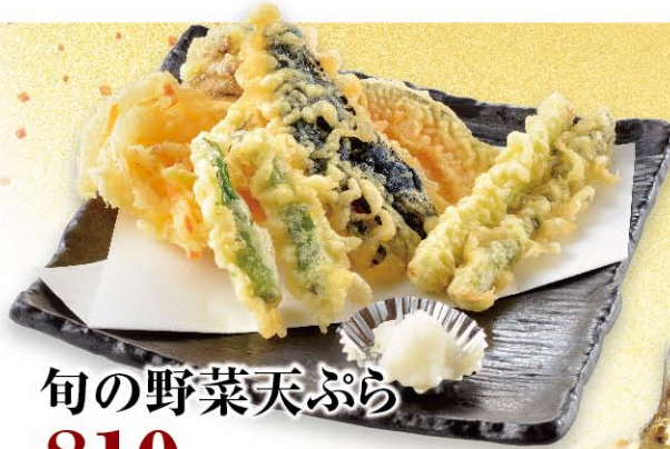
旬の野菜天ぷら 810円 (税込891円)