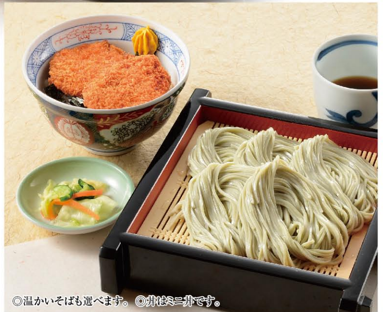
◎温かいそばも選べます。◎井はミニ井です。