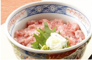
ミニネギトロ丼 730円(税込803円)