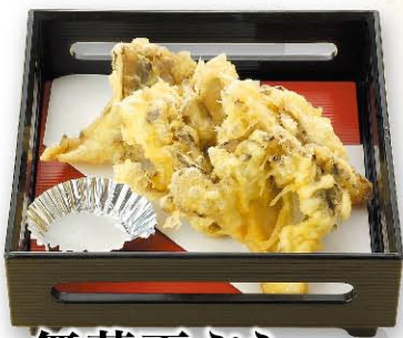
舞茸天ぷら 600円 (税込660円)

衣の付け方に当店独自の技術が生かされています。サクッととした歯触りは今も昔も変わりません。