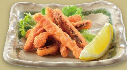
イカの唐揚げ 580円(税込638円)