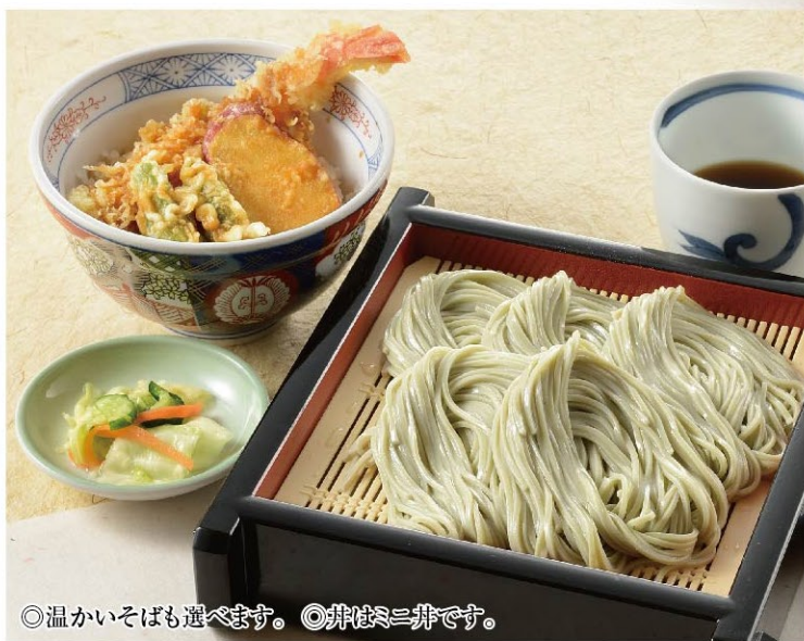
◎温かいそばも選べます。◎丼は≡丼です。