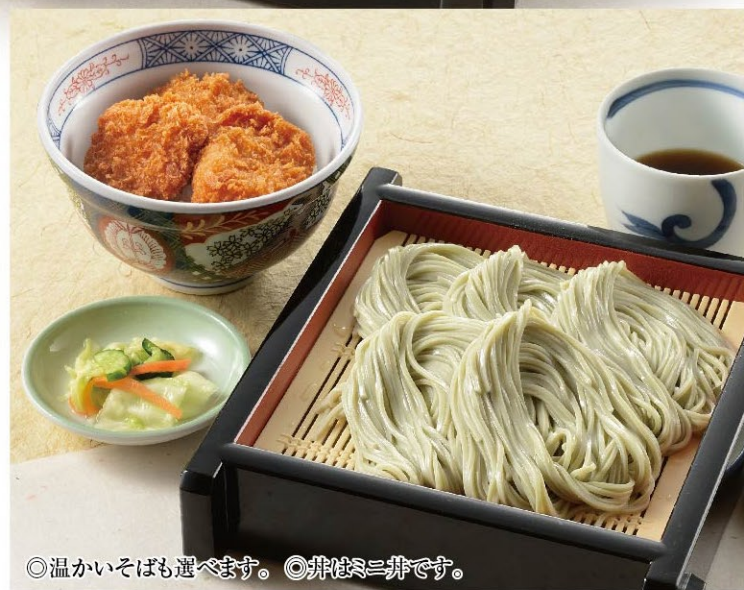
◎温かいそばも選べます。◎丼は≡丼です。